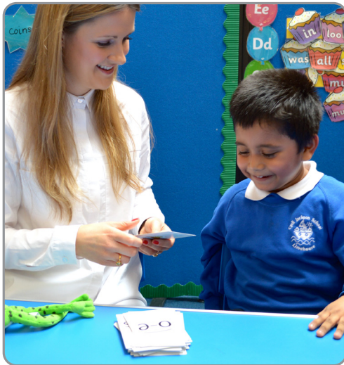
Вивчення Speed Sounds у класі.